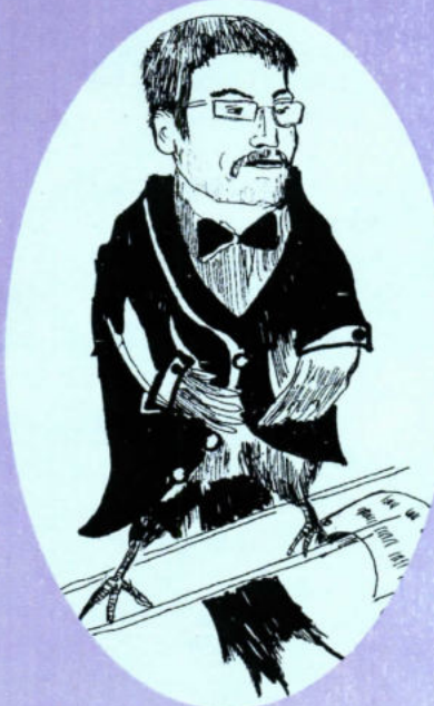
Ф.И.Тютчев об А.Козыреве:

Быть высмеянным—не обуза... Но я твержу вам каждый час: Любите живописца, музы! Не то он нарисует вас.