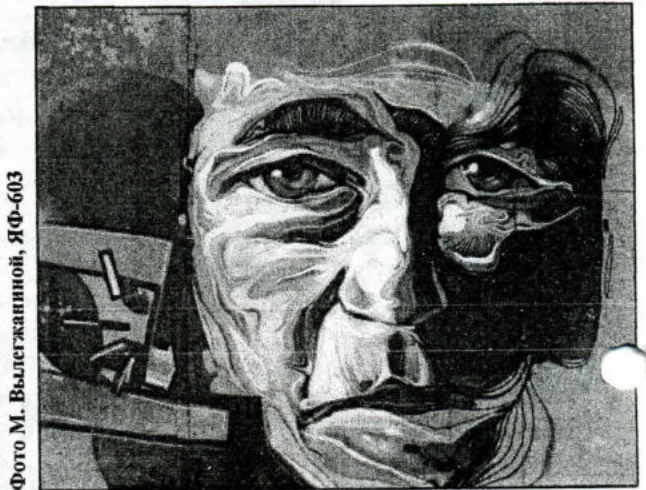
Фото М. Вылегжаниной, ЯФ-603