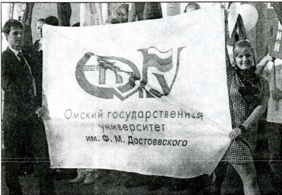
Торжественный вынос флага ОмГУ