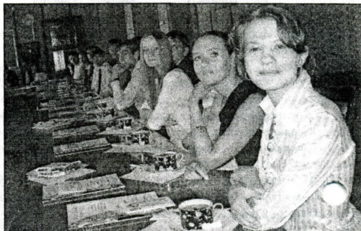
Первокурсники на встрече с ректором

ли сфотографироваться на память – на третьем этаже, у Доски почета ОмГУ. Кто