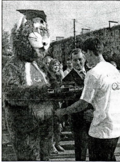
Фото М. Вылегжаниной, ЯФ-603