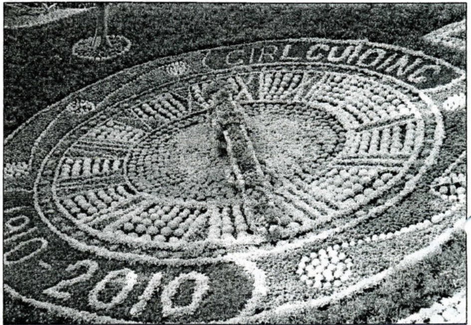
Эдинбург, цветочные часы

В Лондоне мы были четыре дня – в первый день мы были с экскурсией в Виндзорском замке, остальные три дня – ходили по Лондону сами. Интересно, но в Лондоне на первый взгляд почти нет англичан – очень много индусов, китайцев и негров. В Сити никто не живет – это город в городе, где расположено огромное количество офисов и банков, в том числе и Центральный банк, где хранятся золотые запасы многих