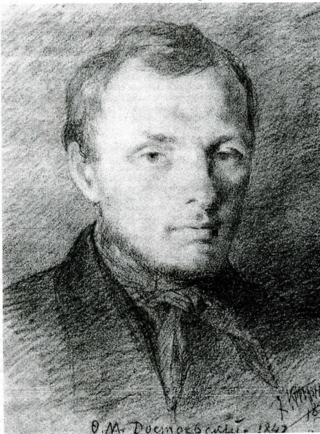
Ф.М. Достоевский. 1842