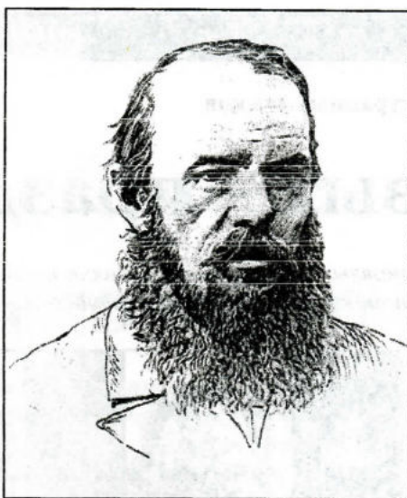
Ф.М. Достоевский. Рисунок (перо, карандаш) Л.Е. Дмитриева-Кавказского (1880 г.)

Третий прижизненный портрет Достоевского принадлежит известному гравюру, рисовальщику, офортисту Льву Евграфовичу Дмитриеву-Кавказскому (1849 – 1916). Он родился на Кавказе в марте 1849 года, в 1869 году поступил в Академию Художеств в класс гравюры, который вел ректор