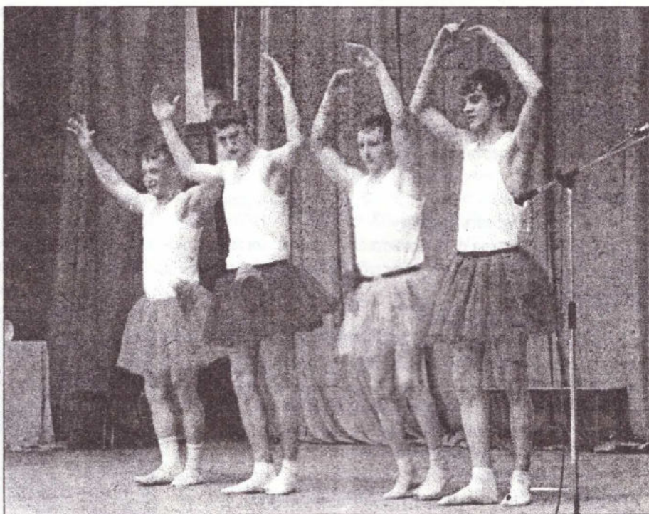
Фото Марина Вылегжанина, ЯФС-603-О

на секретных российских технологиях. Великий Маг спустился в зал и творил подлинные чудеса: угадывал карты, выступал в роли человека-ксерокса, а его помощник сбивал огонь с горящей свечи невидимым кнутом. А в конце выступления, пока помощник на секунду отвлек публику, Великий Маг «совершенно незаметно» исчез со сцены.