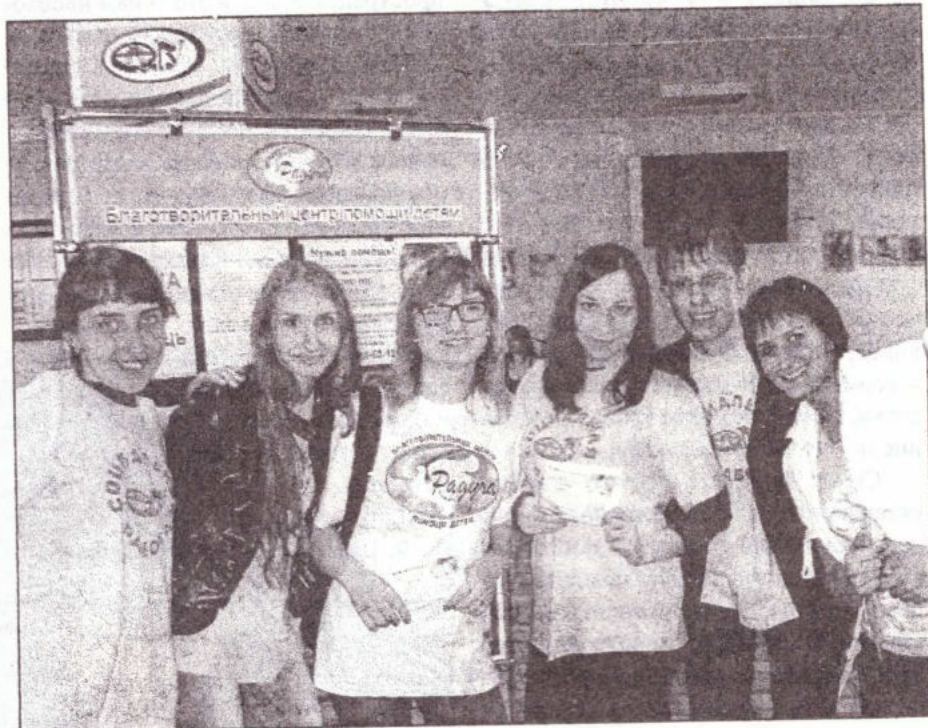
На снимке участники акции - студенты специальности «Социальная работа»

10.00: первые деньги падают в копилку, волонтеры активно раздают листовки с информацией и поделки из бумаги, объясняют всем, кто интересуется, суть акции.