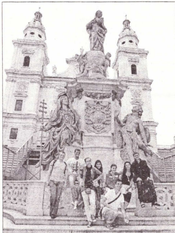
Зальцбург. Возле Кафедрального собора

Очень насыщенной была культурная программа. Сам город Айхштэтт представляет собой один большой исторический памятник, большинство зданий города построено в стиле барокко. Стоит отметить, что до секуляризации город находился во владении католической церкви. Главный корпус университета в прошлом - резиденция епископа. Также мы ездили в один из самых