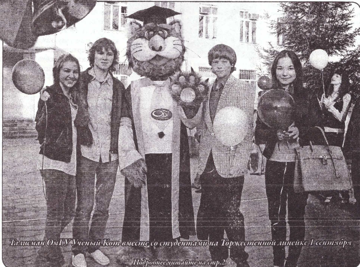
Талисман ОмГУ Ученый Кот вместе со студентами на Торжественной линейке 1 сентября