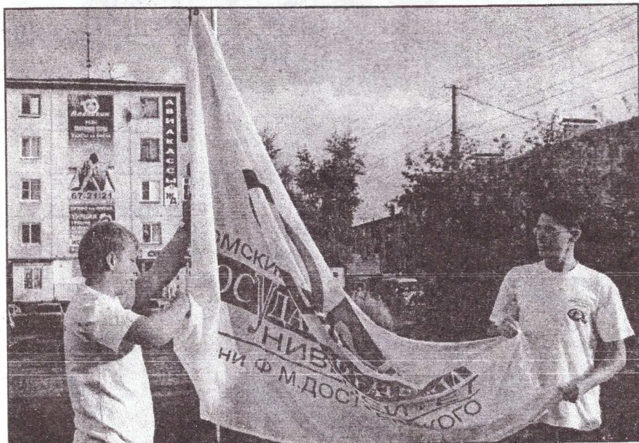
Торжественное поднятие флага