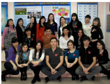
Праздник весны Наурыз отметили в Центре казахского языка и культуры ОмГУ им. Ф.М. Достоевского.

Наурыз означает «рождение весны». По восточному календарю – это первый день нового года, он совпадает с днём весеннего равноденствия. Праздник является символом обновления, торжества любви, плодородия и дружбы. Наурыз – наиболее важный и древний фестиваль восточных народов. Считается, что щедрое празднование принесёт в дом изобилие и успех на целый год. Эти убеждения объясняют большое количество ритуалов и обычаев. С приходом Наурыза все надевают праздничную одежду, ходят друг к другу в гости и желают благополучия в наступающем году.