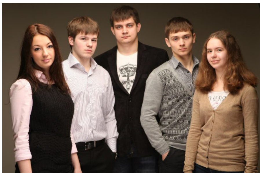
Команда 2-го курса

Жюри улыбается, жюри довольное, гости не разбегаются, слышен дружный смех, разговоры становятся громче, фотограф доходит до галёрки, но сразу уходит, называют места и вручают дипломы: I место – 3 курс (уер-уер!), II место – 4 курс, III место – 2 курс. Я, наверное, впервые в своей жизни согласен с судьями. От всей души поздравляю ребят, именно после таких мероприятий говорят: «важна не победа, важно участие». The European DisUnion – это море позитива и эмоций!