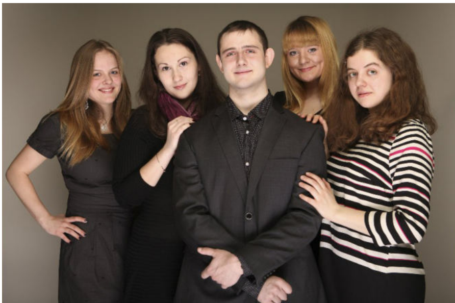
Команда 4-го курса

Шутки шутками, но так получилось, что знакомство с The European DisUnion – саммитом, приуроченным ко дню специальности «Мировая экономика», – началось с пиар-акции. Плакаты, на которых студенты ФМБ были похожи на звёзд шоу-бизнеса,